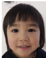
かいせ すずちゃん (2歳9ヶ月) 友達のお母さんが来る と荷物を持ってきます。