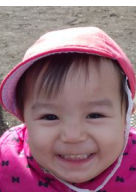
あおやま すすかちゃん (1歳11ヶ月) 体を前後に動かしてラ ンコに乗ります。